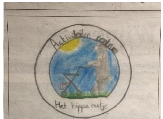
Leerlingen van De Regenboog tekenden zelf het logo

https://sites.google.com/view/hethippeoudje/video-pagina?authuser=0